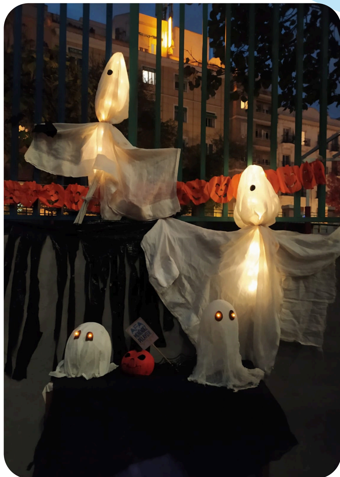
Detalle de la decoración de Halloween hecha por la comisión