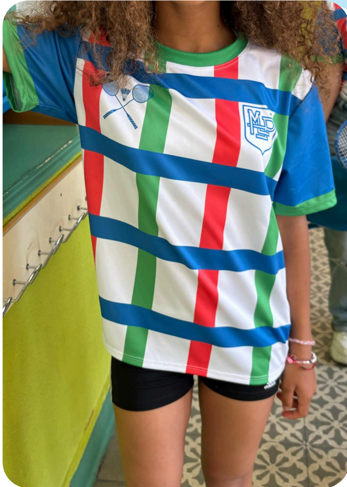
Nueva equipación deportiva oficial del Colegio

Se han diseñado y financiado las equipaciones deportivas para el equipo de Bádminton durante este curso.