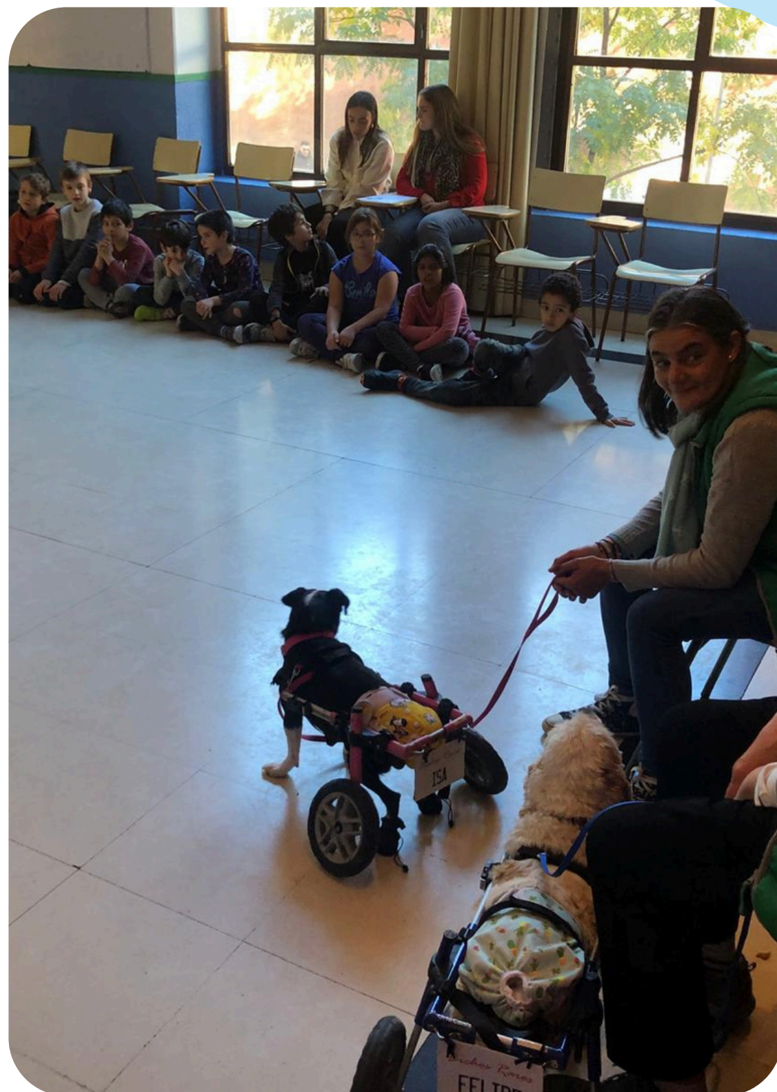
Foto de las jornadas de la Diversidad