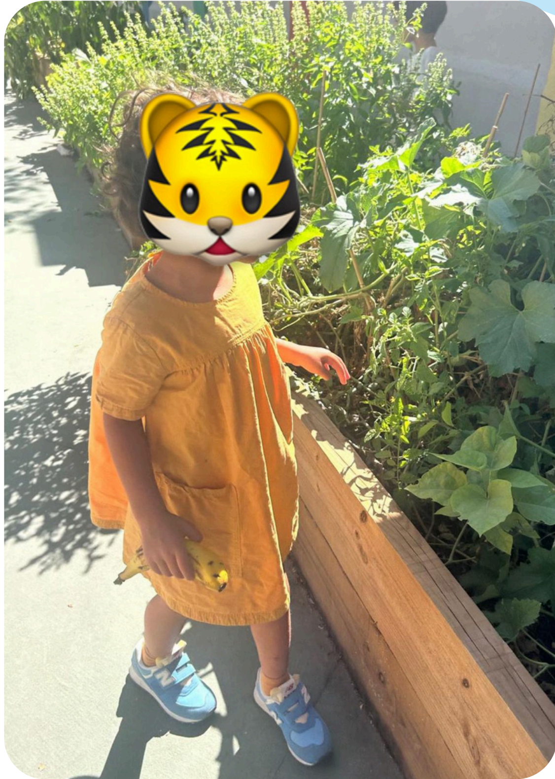
Huerto escolar en el patio de primaria