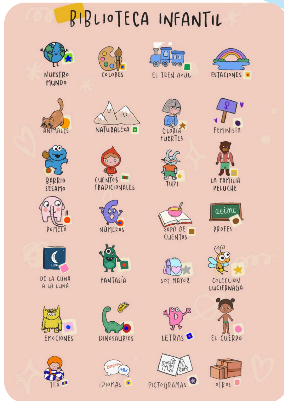
Detalle del cartel con leyenda para la clasificación de la biblioteca

Un año más se ha celebrado el concurso de relatos para alumnado de primaria,, con más de 60 obras recibidas, y organizado la entrega de premios y diplomas en salón de actos..