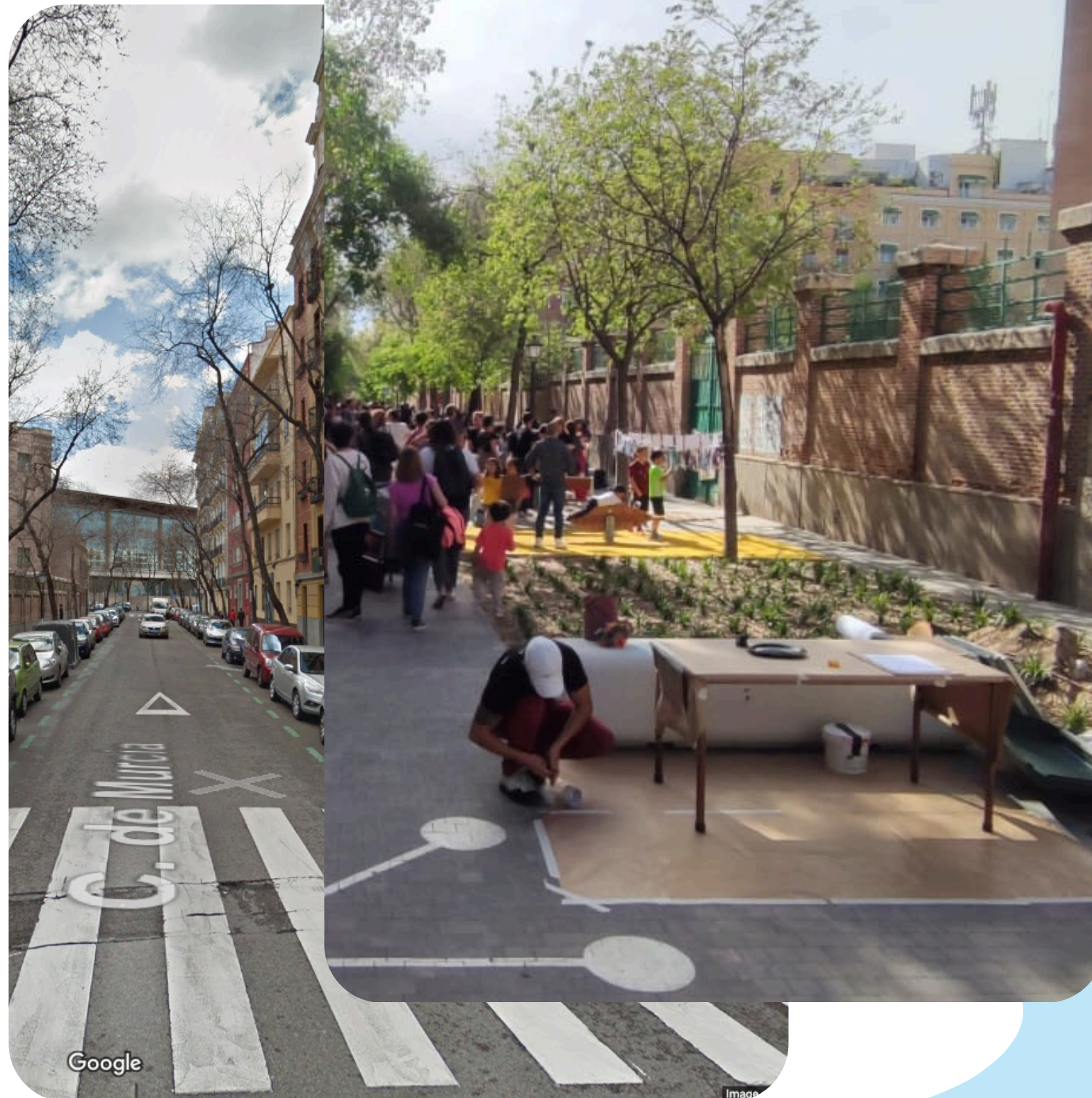
C/Murcia antes y después de la peatonalización

Durante el evento, se presentó una exposición de fotografías que recogía el proceso de Revuelta Escolar de los últimos años. Esta reivindicación ciudadana ha sido clave para que el colegio Menéndez Pelayo fuese incluido en el programa municipal de reverdecer entornos escolares.